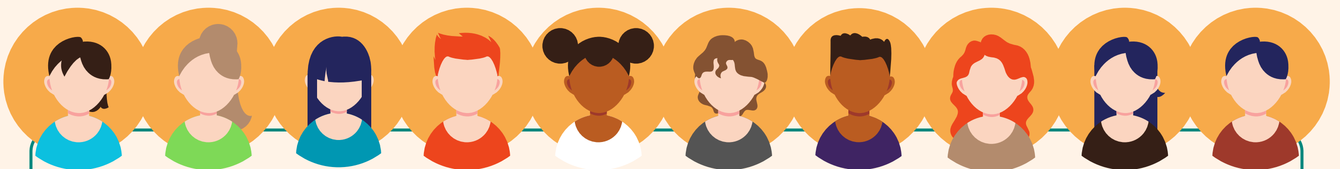
Zorg- en welzijnsorganisaties met coördinatoren Samen Oplopen (Verspreid over het land voeren coördinatoren de aanpak Samen Oplopen (Start Kansrijk) uit.)