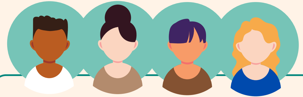
Comité van Advies