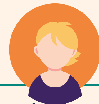
Marketing & communicatie